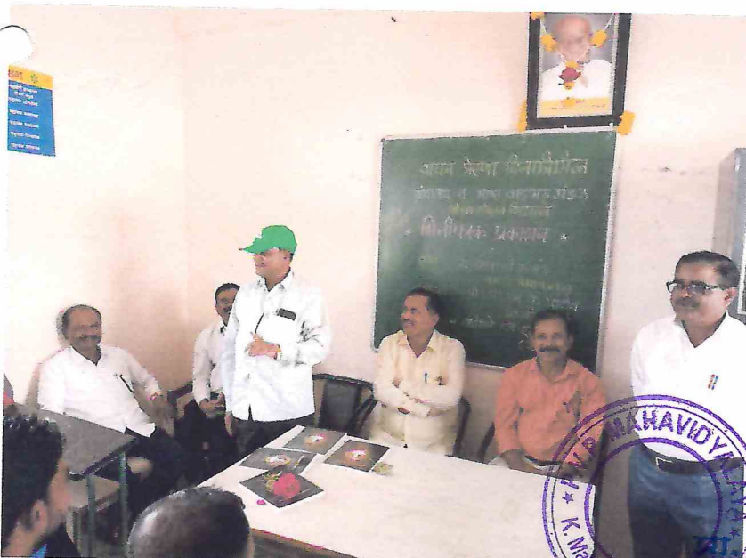
विद्यार्थीना मार्गदर्शन करताना