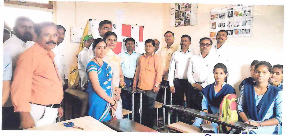
विद्यार्थीसेवक प्राध्यापक वर्ग